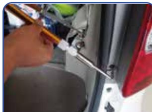
各先端部は240度前後屈曲、回転するのであらゆる箇所を捉えることが可能。