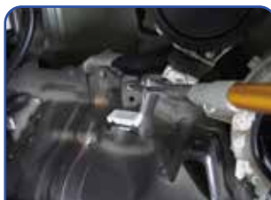
ボディのホールからも測定可能。