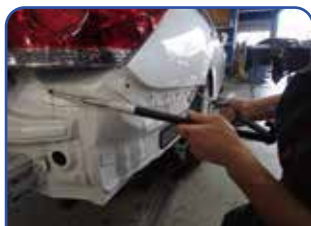
バランスゲージの届くところであれば全て測定可能