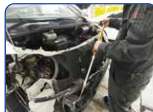
フロントフェンダー等を外さなくても測定できます。