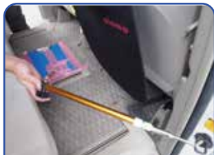
車両のセンターポイントを即座に作成可能。