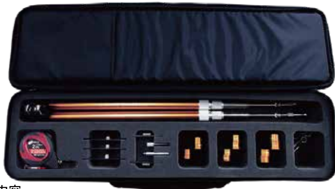
専用ケース (W620×L180×H90mm, 1.340g)