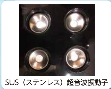
SUS (ステンレス) 超音波振動子

SUS 超音波振動子を4個搭載し、 毎秒170万の高周波振動を発生させ、 除菌水を1~5ミクロンの超微粒子に霧化し 送風で空間に噴霧します。短時間での除菌・消臭作業が可能となります。